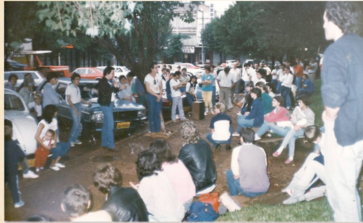
As primeiras reuniões e assembleias eram realizadas a céu aberto, em locais improvisados

Fundado no dia 17 de maio de 1986, o Sindicato dos Bancários de Toledo, hoje denominado SINTRAFI (Sindicato dos Bancários, Financeiros e Trabalhadores do Ramo Financeiro) está comemorando seus 40 anos de existência. Nessas quatro décadas, a entidade forjou a sua trajetória numa luta incansável em defesa da categoria bancária, da democracia e de interesses da classe trabalhadora em geral. Esteve presente nas maiores lutas da categoria bancária e participou da criação da Fetec-CUT/PR, da Contraf-CUT e do Pactu.