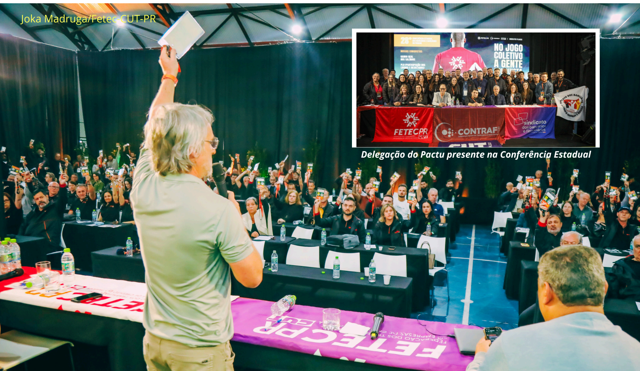
Delegação do Pactu presente na Conferência Estadual

A Fetec-CUT/PR realizou nos dias 15, 16 e 17 de maio, a 28.ª Conferência Estadual das Bancárias e Bancários do Paraná. O evento aconteceu no Espaço Cultural e Esportivo do Sindicato dos Bancários e Financeiros de Curitiba e contou com a participação de delegadas e delegados representando os Sindicatos do Pactu e demais entidades filiadas à Fetec-CUT/PR. A Conferência Estadual constitui uma etapa importante da Campanha Nacional da categoria, porque é nela que as bancárias e bancários do Paraná aprovam as demandas que serão levadas à Conferência Nacional, para ajudar a compor a pauta de reivindicações da categoria. Entre os temas principais, além de aumento real, manutenção do emprego e melhores condições de trabalho, a categoria